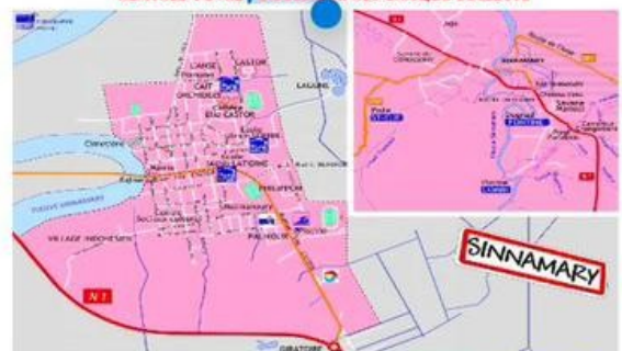
Jours de collecte des Ordures Ménagères LUNDI & JEUDI MATIN